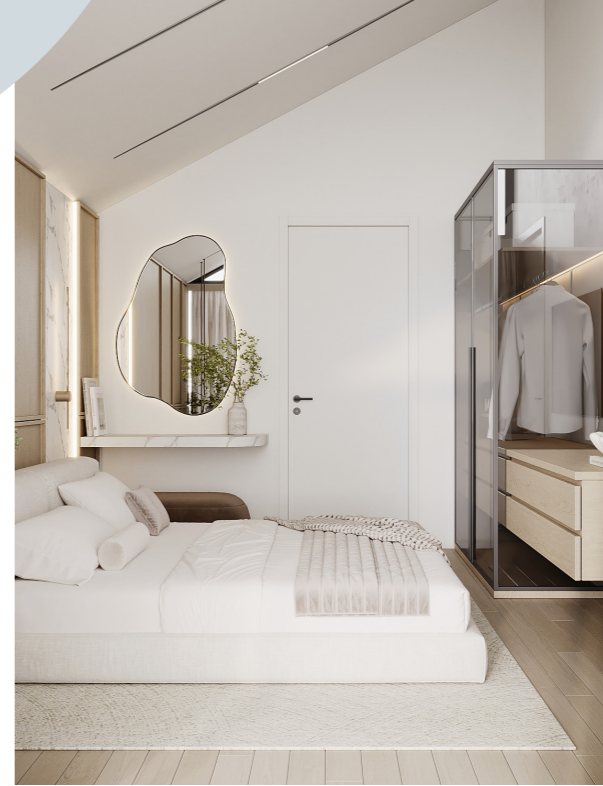
Tibitsch 20 9212 Techelsberg am Wörther See